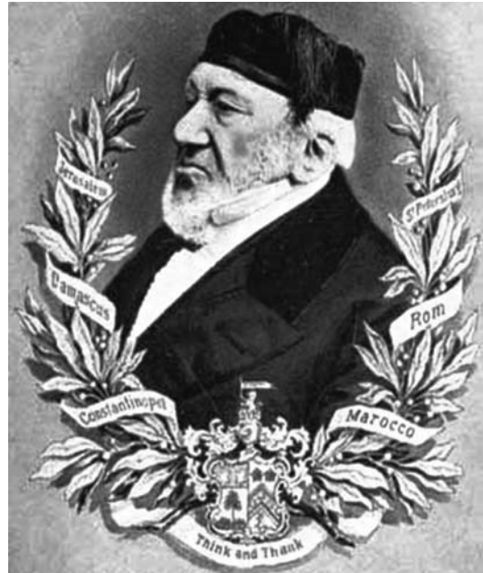
השר סיר משה מונטיפיורי מבריטניה

בעת שהייתו הקצרה יחסית בצפת שיקם את חורבות בית הכנסת "אלשיך" (אשר היה ידוע לימים כבית הכנסת "סטמבוליה" ע"ש יוצאי תורכיה שנהגו להתפלל בו), ושמו חרות באבן הראשה של בית הכנסת עד היום. שם גם השיא את אחת בנותיו למשפחת הלוי הצפתית.