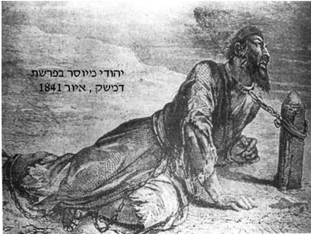
יהודי מיוסר בפרשת דמשק, איור 1841

תמונתו של יהודי מעונה בפרשת דמשק (צייר אלמוני) האיור משנת 1841.